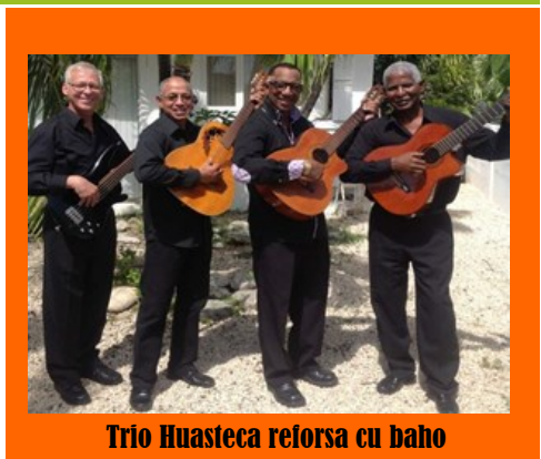
Trio Huasteca reforsa cu baho